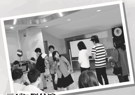
キャラバン隊公演

発行 静岡市静岡手をつなぐ育成会 静岡市葵区城内町1-1 静岡市中央福祉センター2F Tel 054-254-5218 Fax 054-269-5034 e-mail: info@s-ikuseikai.jp http://www.s-ikuseikai.jp// 事務局開局：平日9:30~15:00