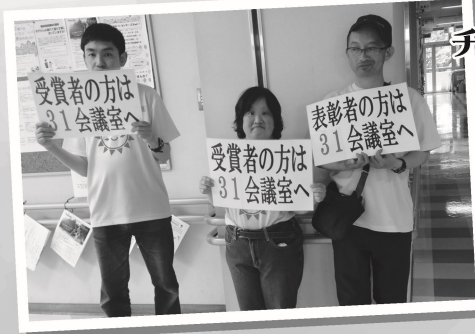
チーム太陽大活躍