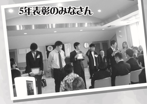
5年表彰のみなさん